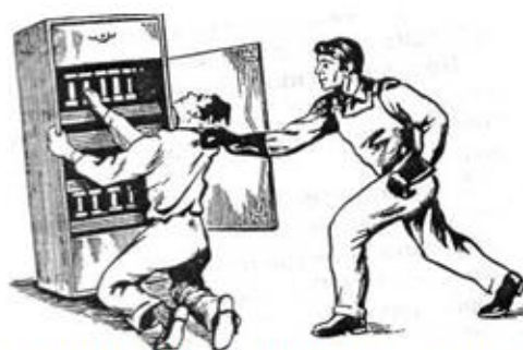
Рис. 4. Освобождение пострадавшего от токоведущей электрической части

6.2. При поражении электрическим током необходимо быстро освободить пострадавшего от действия тока - немедленно отключить ту часть электроустановки, которой касается пострадавший. Когда невозможно отключить электроустановку, следует принять иные меры по освобождению пострадавшего, соблюдая надлежащую предосторожность