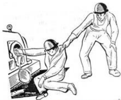
Рис. 3. Освобождение пострадавшего от действия части, находящейся под напряжением до 1000 В