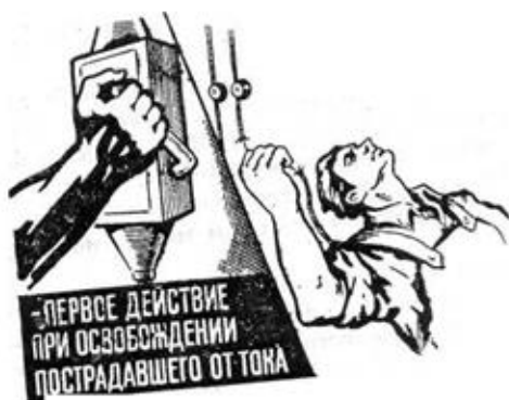
Рис. 1. Освобождение пострадавшего от действия электотока путем отключения электроустановки

6.1. Быстрое отключение от действия электрического тока это первое действие для спасения пострадавшего.